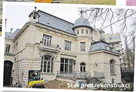
Stav před rekonstrukcí